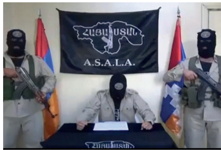
Те, кто использует террор как инструмент государственной политики, в итоге сами становятся его жертвами