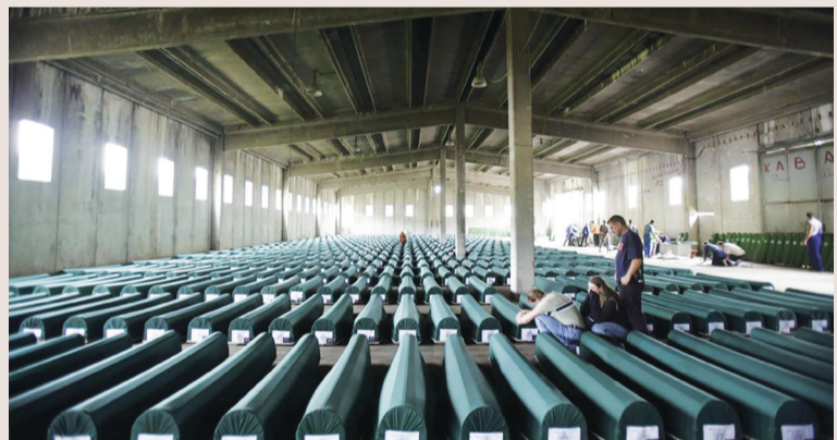
Резня в Сребренице стала самым массовым преступлением в Европе после 1945 года и оставила глубокую рану в коллективной памяти региона и всего международного сообщества.

В новейшей истории Армении, пожалуй, не было более значимого момента для пересмотра национальной мифологии, чем сейчас. Пашина и его команда, столкнувшись с угрозой внутреннего реваншизма, проявляют редкую политическую решимость. Вопрос уже не в идеологических спорах, а в том, хочет ли страна стать современной демократией или остаться пленницей страха и фантомов. Пашина понимает: враг может быть ближе, чем кажется, и если его не остановить сейчас - он снова ударит по своим.